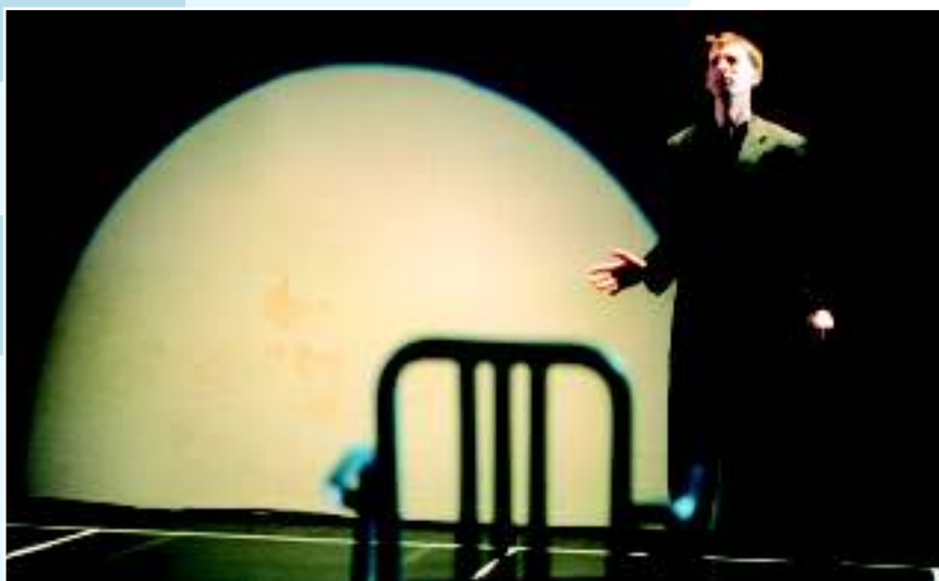
Анна Богарт и « SITI Company »: « BOB » (1999 и 2002 гг.)