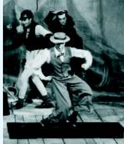
«Ковчег сумасшедших», Прага, 1989 г., фото: Владимир Гуральчик

В начале восьмидесятых годов в квартале Браник на окраине Праги в рамках Браницкого театра пантомимы возникла даже самостоятельная труппа, которая, наряду с постоянной пантомимической сценой театра «На забрадли» представляла собой художественную учебную базу для многочисленных молодых любителей пантомимического искусства. И именно пражская периферия стала местом, где на свободных пространствах, в молодежных клубах и других, поначалу «не-театральных» учреждениях происходило дальнейшее развитие этого жанра, о чем свидетельствует несколько спектаклей «Цирка Альфред», постановки Бориса Гибнера «В конце сада именов Голливуд» или замечательных в художественном плане и в то же время политически ангажированных спектаклях «Общества Альфред» под руководством Цтибора