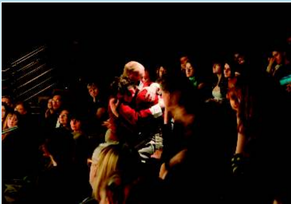
Из постановки пьесы Ф.М.Достоевского « Братья Карамазовы »