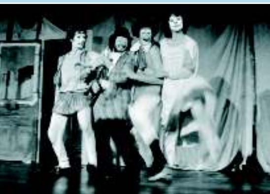
Постановка спектакля «Autour d'une porte» Цтибора Турбы, Франкфурт на Майне, 1981 г.