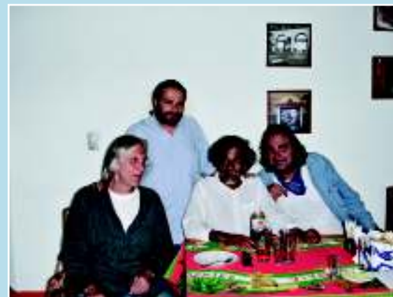
Встреча с Франциско Толедо