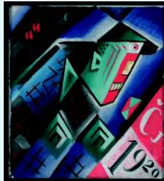
Фантомас, 1920 г.