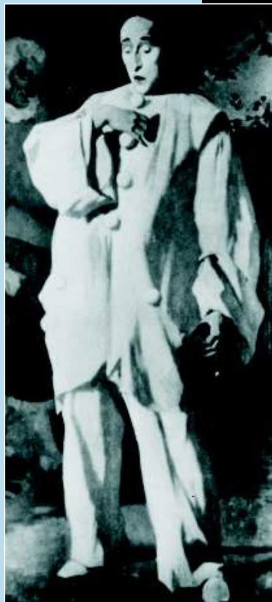
Ж. Г. Дебюро на картине Жана Пезу