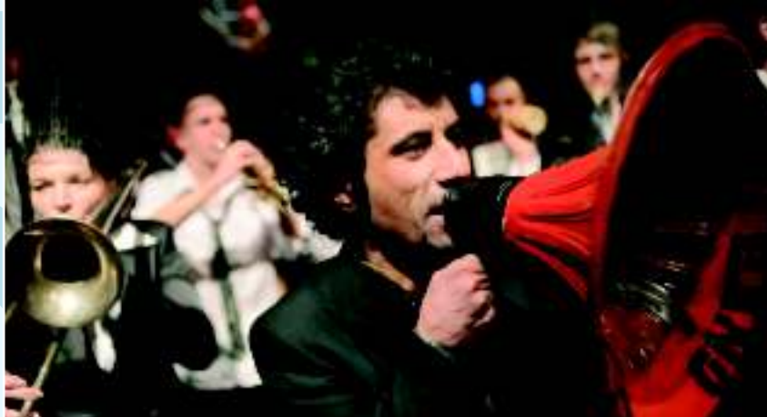
«Алстар Рефюджи Бенд» в спектакле «Танец через забор» (2008 г.)