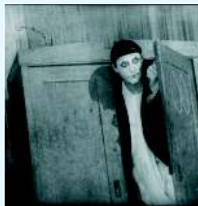
Болеслав Поливка, театр «На веревке», Брно, 1983 г.