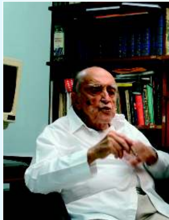
Архитектор Оскар Нимейер