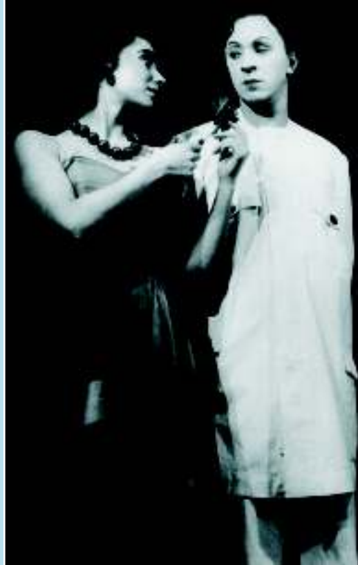
«Цирк надежды», Театр сатиры, Прага 1948 г.

Непосредственную реакцию на политические события 1968 года, а также совершенно другую концепцию искусства пантомимы представляет собой связанная прежде всего с именами Бориса Гибнера и Цтибора Турбы так называемая «вторая волна» чешской пантомимы. Уже вступительный спектакль их театральной труппы «Пантомима Альфреда Жарри» с названием «Харакири» представил в декабре 1968 года совершенно другую поэтику как в драматургическом, так и в формальном плане. Их образы бродяг и сенильных стариков с окраины общества ясно демонстрировали абсурдное положение человека в обществе, полностью разращенном оккупацией и последующей политикой «нормализации». Постановки показывали неопределенные типы людей, живущих в атмосфере равнодушия, общественного и человеческого разорения, бедности и депрессии, а игра мимов на сцене вылилась в метафоры самоубийства (Ц. Турба «Сделай ему это справа» или «Турба тацет» ) или агрессии (Б. Гибнер «Идиоты» ). Однако, «Театр Альфреда»