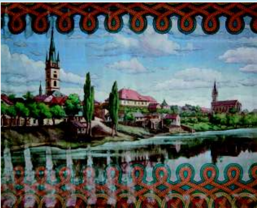
К традиции чешского любительского театра с самого начала принадлежали расписанные занавесы (г. Часлав)

показывали до 5000 спектаклей в год). В любительских коллективах появились режиссеры, которые стремились как к сложному репертуару, так и к более современной концепции режиссуры, другие подключились к усилиям художественного авангарда. Любительский театр и далее оставался инкубатором талантов для профессионального театра.