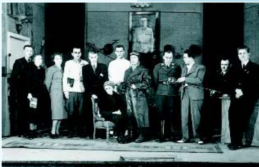
Из постановки спектакля «Мать» К. Чапека, Валашске-Мезиржичи, 1939 г.