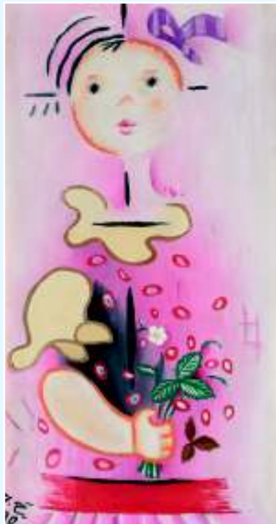
Девочка с клубникой, 1930 г.