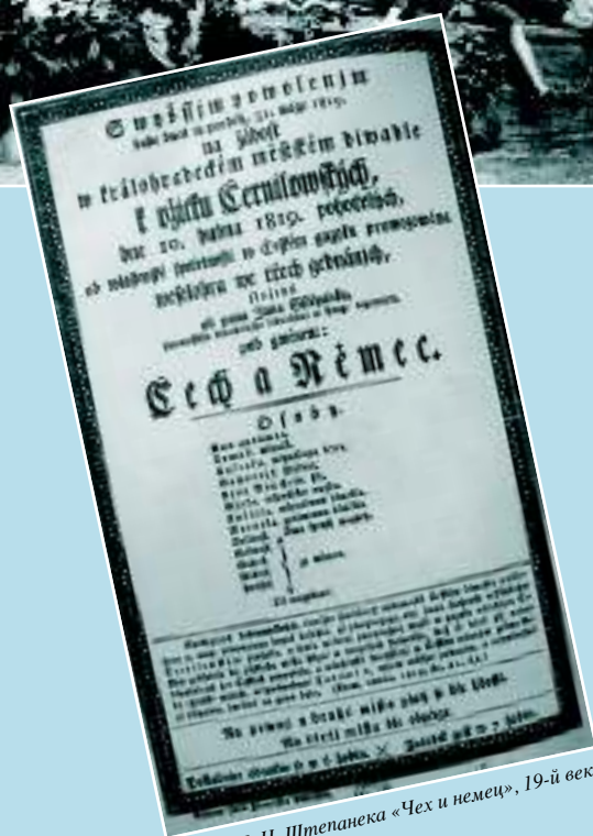
Пьеса Я. Н. Штепанека «Чех и немец», 19-й век