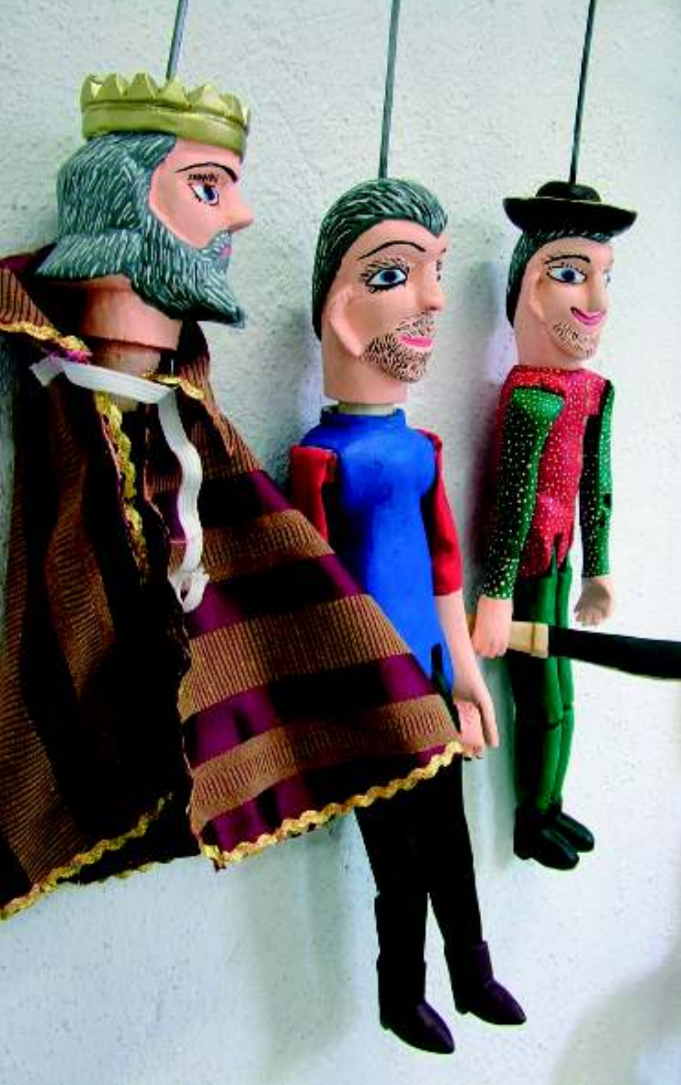
Работы земледельцев-резчиков, Оахака