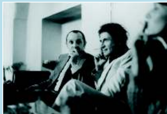
Слева Ладислав Фиалка и Марсель Марсо в театре «На забрадли»