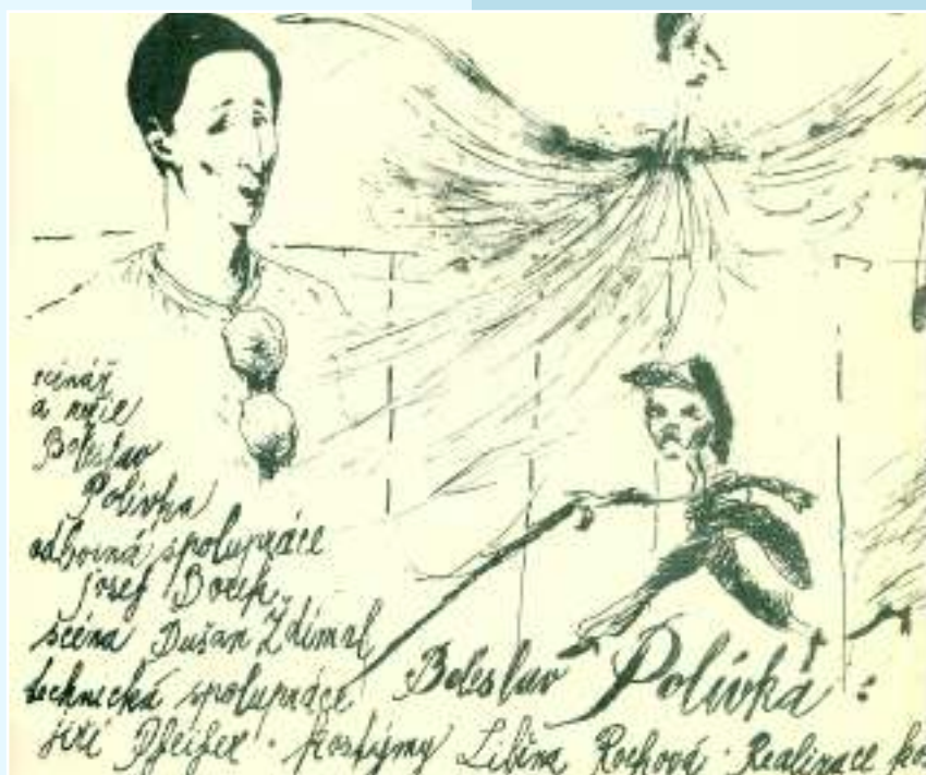
Программа спектакля «Сеанс» в театре «На веревке», Брно, 1983 г.