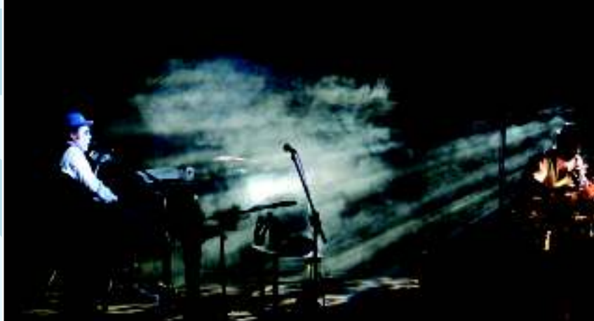
« The Tiger Lillies » (2008 г.)

Театр «Арха» находится в центре Праги в местах, где после второй мировой войны работал известный чешский авангардный режиссер Э. Ф. Буриан. Именно его наследие воплощает в жизнь современная драматургия театра «Арха». Рядом с гастрольными представлениями в «Архе» возникает и ряд оригинальных проектов современного чешского театра. Их авторами являются известные мировые и, прежде всего, чешские режиссеры, музыканты, перформеры и художники. Свой художественный дом здесь нашел, например, импровизатор Ян Душек, художник Петр Никль, режиссер Арност Гольдфлам и коллектив серьезной музыки « Agon Orchestra ». Все они здесь создали ряд авторских постановок, которые принадлежали к тому самому прогрессивному и оригинальному, что в чешском театре и музыке появилось за последние двадцать лет. Из многих назовем постановку « Опера ла Серра » (авторы Михал Вих и Ярослав Душек, 1994 г.), « Сладкий Терезиниатадт » (Арност Гольдфлам, 1996 г.), « Гримм Гримм » (Мин Танака, 1997 г.), « Солнцеворот », « В зеркале » и « Обношенные сны » (Петр Никль, Яна Свободова, 1997, 1998 и 2004 гг.), « Э.Ф.Б. – Молот театра » (Йиржи Покорни, 2004 г.), цикл авторских исповедей Арноста Гольдфлама « Мазохист-Войер-Маньяк » (2006–2008 гг.) или совместные концерты с легендой чешской андерграундовой музыки The Plastic