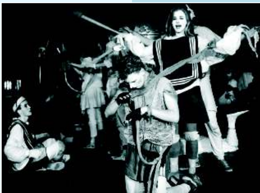
Пражский театр поэзии «Орфей», 1985 г.