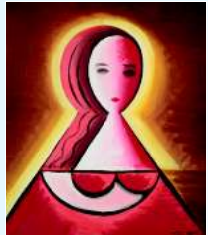
Молодая женщина, 1915 г.