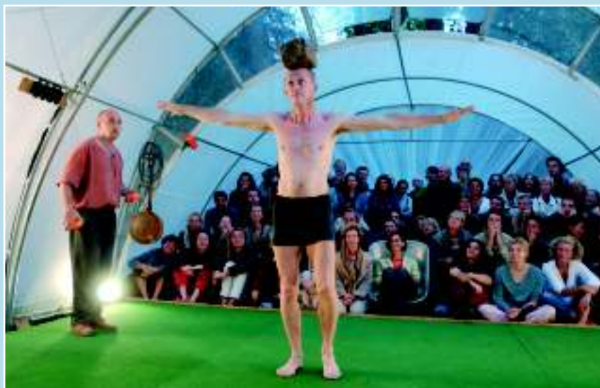
Ателье «Lefevre & André»

В этом году фестиваль был проведен 19–31 августа и носил исключительный характер, так как предложил сразу три исключительных заграничных коллектива. «Cirque Trottola» вернулся на Летну спустя три года. «Троттола», так же как и название самого нового представления «Волчок», обозначает детскую игрушку – юлу, которая может сама крутиться, но ей необходим правильный импульс. Сочетание артистических возможностей трех членов – датчанина, француза и швейцарки – буквально захватывает дух. Удивительный жонглер. Силач, который поднимет, кажется, и земной шар. И буквально чудом является кро-