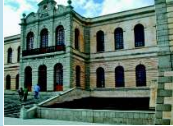
КАСА Сан-Августин Этла, Оахака