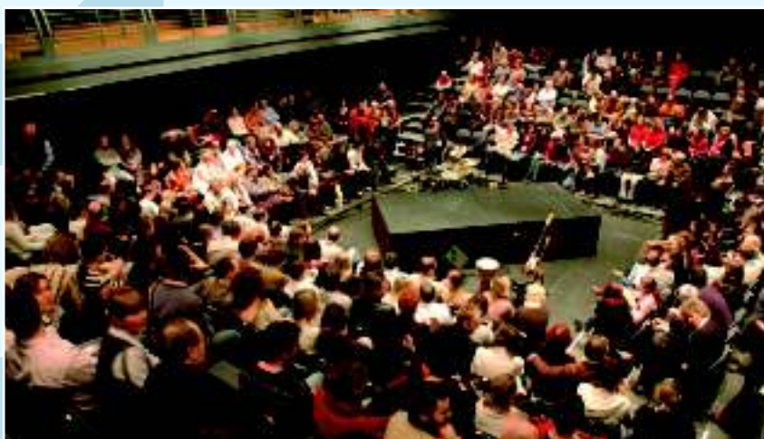
Большой зал театра «Арха»