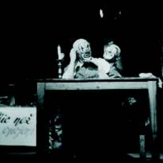
«Цирк надежды», Театр сатиры, Прага 1948 г., фото: архив автора

Всемирное развитие современного театра находило свое отражение в чешской культуре еще с тридцатых годов минувшего века в области театра пантомимы. Идейное начало интереса к этому художественному жанру можно обнаружить в программных поисках теоретиков поэтизма как представителей отечественного художественного авангарда. Свою роль при популяризации этого жанра сыграла, наверное, также и традиция популярного в чешской народной среде театра комедии. Выразительную отличительную черту этого жанра в народном театре представляла полная юмора пантомимическая клоунада.