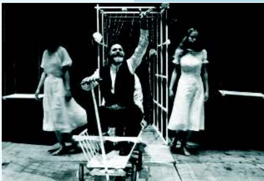
«Кладивadlo», 1963 г.