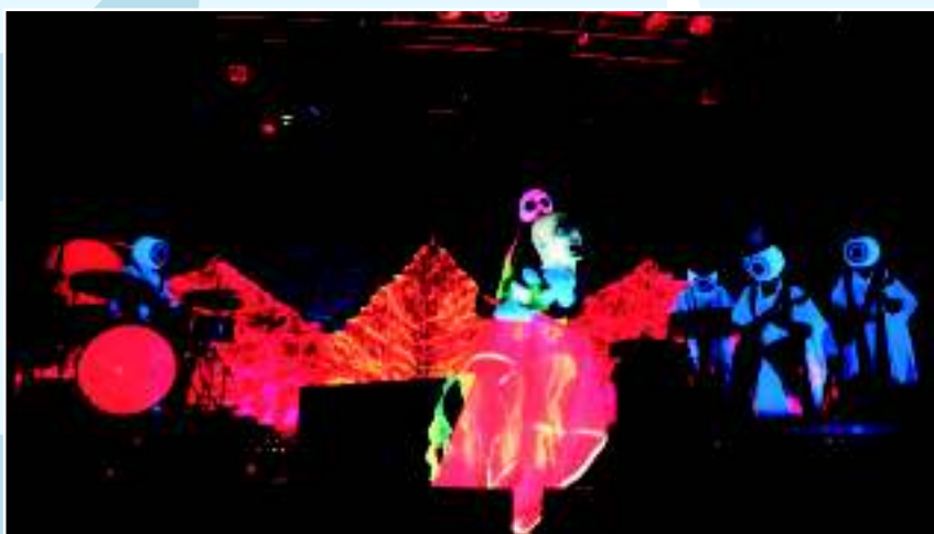
The Residents : « Wormwood » (1999 г.)