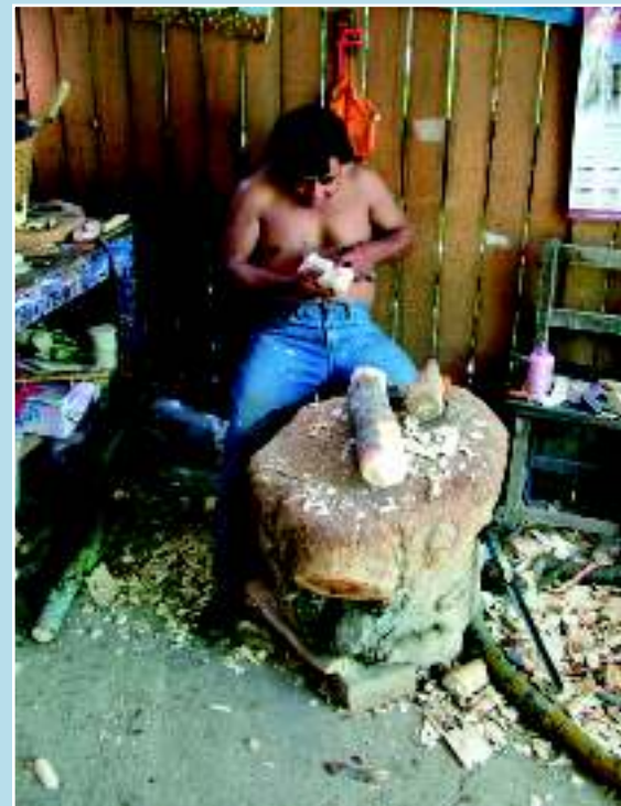
Мексиканский индеец вырезает куклу