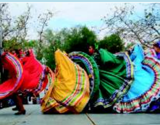
Мехикали – «Tecate festival»