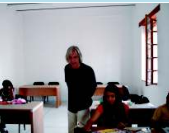
Курсы живописи, Оахака