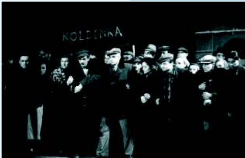
Народный театр «Свиави», инсценировка романа «Анна-пролетарка» на фестивале «Йирасков Гронов»