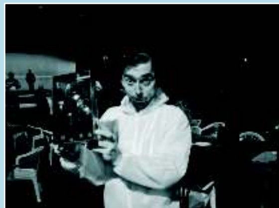
Из постановки пьесы «Цирк» В. Гавела