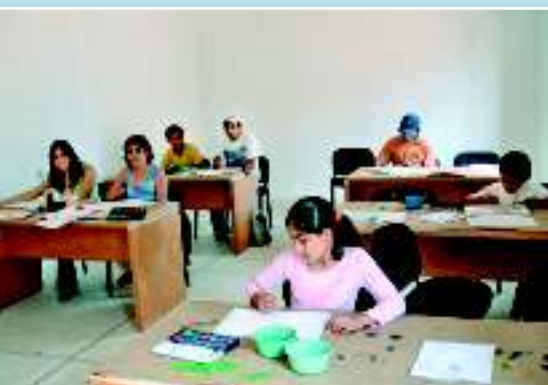
Курсы живописи, Оахака