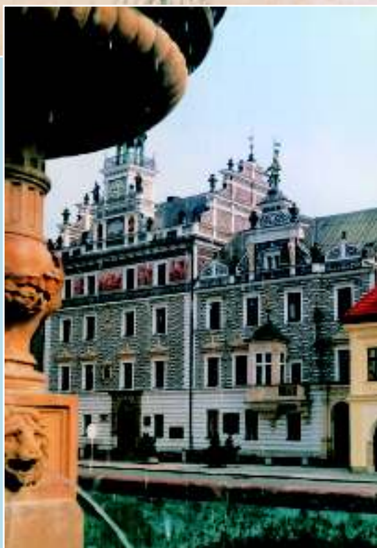
Коллин, родной город Яна Кашпара Дебюро