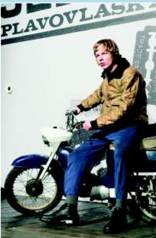
Из постановки пьесы «Любовь одной блондинки» (инсценировка фильма М. Формана)