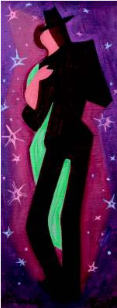
Красная ночь, 1933–1937 гг.

корять в мире, кроме себя. Я умру бедным», читаем мы в книге «Написано в облаках». На самом деле у него были уже такие работы, что ими бы можно было наполнить несколько творческих жизней. На одну хватило бы его рассказов, эссе, прозы и драматургии, на вторую журналистских текстов, художественной критики и теоретических эссе, на отдельную карьеру – сценографические работы, карикатуры, иллюстрации и обложки книг, при этом у нас еще остается творчество художника, которое было главным для Чапека.