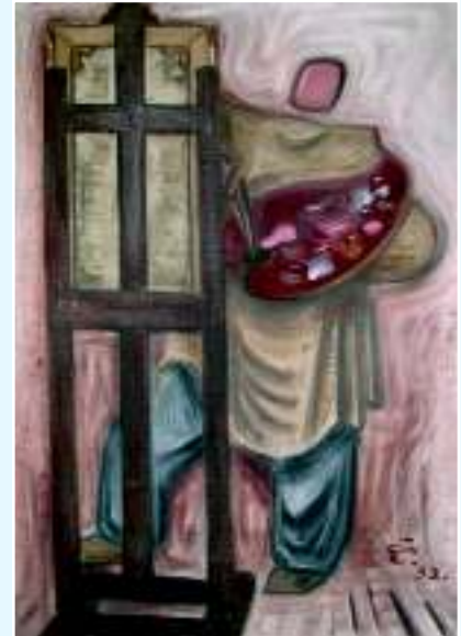
Художник, 1933 г.