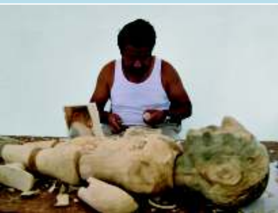
Кукольная мастерская, Оахака