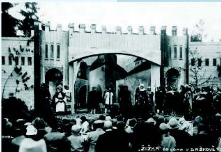
Театралы-любители праздновали зарождение республики постановками патриотических спектаклей, Држков, 1925 г.

Возникновение независимой Чехословацкой Республики в 1918 году вызвало большой бум любительских обществ (только общества Центральной организации чехословацких театралов-любителей