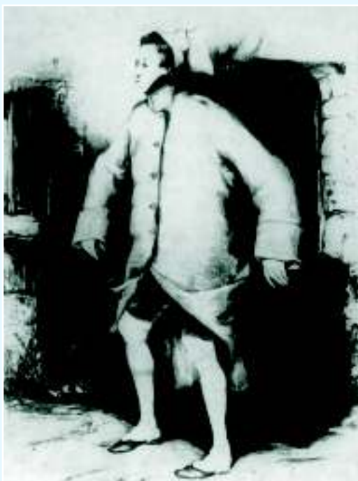
Ж. Г. Дебюро на рисунке Оюста Буке в роли рекрута в пантомиме «Купюра достоинством в тысячу франков»