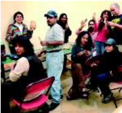
Кукольная мастерская в Магдалене, Мехико-Сити

влением марионетки, с ее вождением и с европейским театром марионеток. Во второй фазе они ближе познакомились как с технологией производства марионеток, так и с искусством их вождения. В заключении курсов была осуществлена постановка конкретной театральной пьесы, переведенной на испанский язык. В конце курсов состоялись премьеры пьес, поставленных участниками курсов.