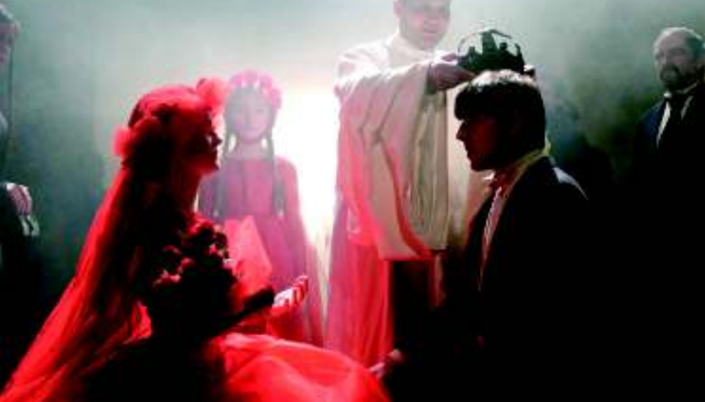
Из постановки Ф. М. Достоевского «Идиот»