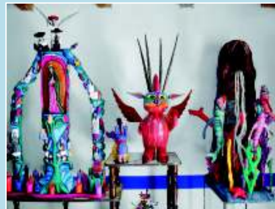
Воркшоп в Оахаке