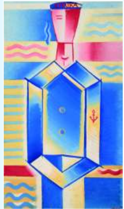
Морьяк II (Африка), 1917 г.