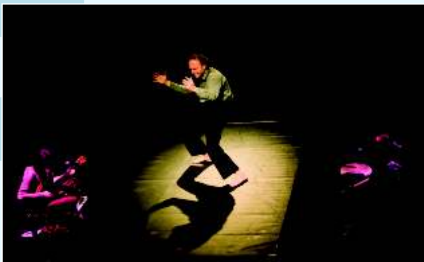
Театр «Визита» (2008 г.)