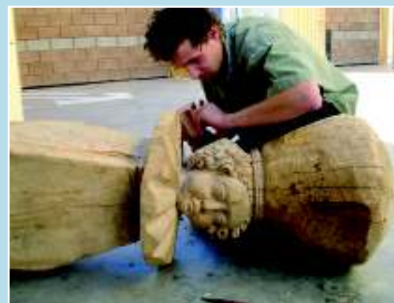
Пражский ангелочек, подарок мексиканцам