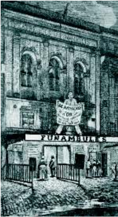
«Канатоходцы» (Les Funambules). Рисунок А. Мартиала 1862 г.

на сцену, опять расходятся. Во всяком случае, славный мим в прежней форме опять оказался в театре. У него, однако, возобновляется его старая болезнь – астма.