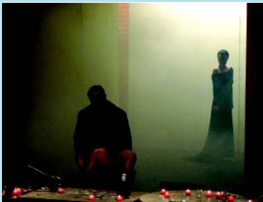
Из постановки пьесы Ф.М.Достоевского «Преступление и наказание»