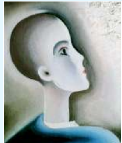
Изумление, 1916 г.

Когда Йозеф Чапек в конце тридцатых годов оценивал свое творчество, у него не было иллюзий о его ценности: «В свои пятьдесят я в искусстве добираюсь до того, где должен был быть о, горе! уже в двадцать пять. Я не хотел ничего по-