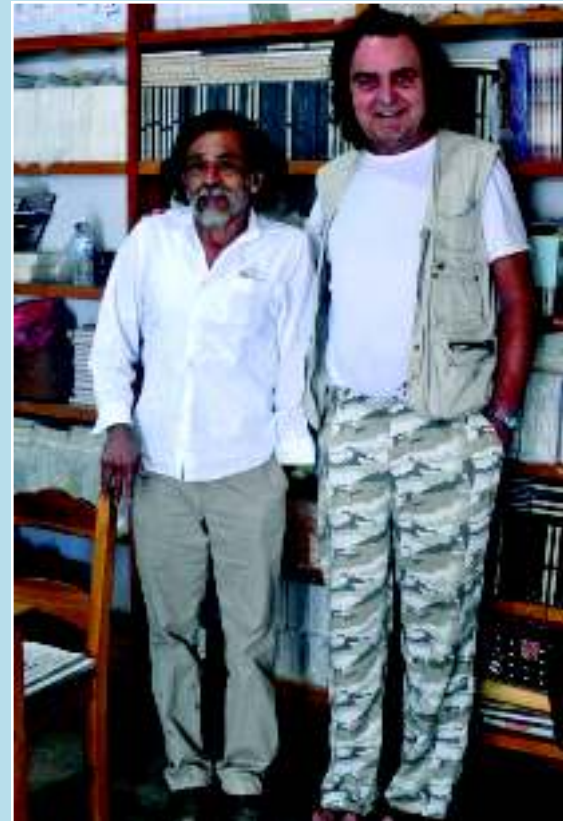
Петр Котик с Франсиско Толедо