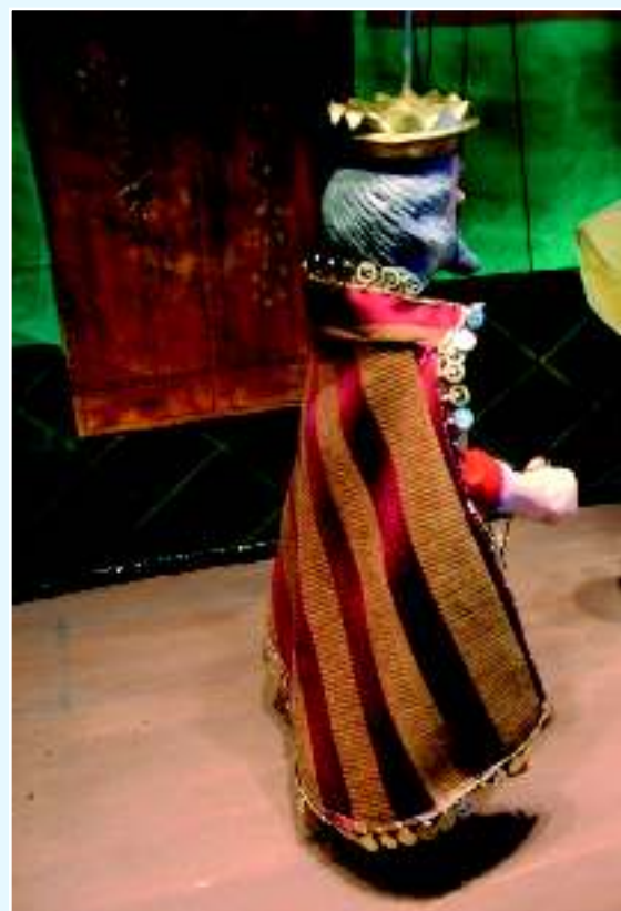
Кукольный театр, Оахака

С помощью проведения Чешской культурной мастерской в Бразилии объединение снова хочет создать действующую модель уникальной творческой атмосферы как базы для представления оригинального и традиционного чешского театра марионеток в нескольких штатах Бразилии. Совместно с бразильскими артистами на португальском языке будет поставлена театральная пьеса из мастерской чешских кукольников. Одновременно там будут действовать курсы обучения технике живописи и состоится альтернативное театральное представление, подготовленное совместно с местными артистами. Одновременно в рамках этого проекта будут работать курсы актерского мастерства для актеров театра марионеток и художественные воркшопы для детей от 10 лет. К первым спонсорам этого проекта принадлежит компания Grano, o.o.o и Hostel Elf – Прага, o.o.o.