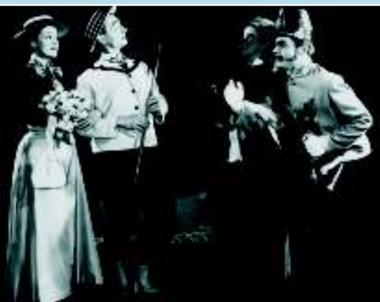
«Девять шляп на Прагу», театр «На забрадли», Прага 1964 г., фото: архив автора

Конец второй мировой войны в 1945 году принес новое оживление международных контактов и на культурном поприще. В чешских кинотеатрах появился прославленный фильм Марселя Карнэ и Жака Превера «Дети рая» , снятый в 1943–44 годах. Замечательное исполнение артистом-мимом Жаном-Люком Барро роли легендарного представителя французской пантомимы Жана Гаспара Дебюро настолько вдохновило двух молодых артистов – будущего славного чешского актера Мирослава Горничека и его друга, голландца Альфреда де Моль, что они вместе подготовили в Праге спектакль «Цирк надежды» , постановка которого в пражском «Театре сатиры» в 1948 году пользовалась чрезвычайным успехом. Коммунистический переворот в том же году принес с собой, однако, и сталинские доктрины о социалистическом искусстве: пантомима была провозглашена формалисти-