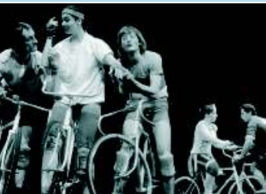
Постановка спектакля «Giro di vita» Цтибора Турбы, Прага, 1992 г., фото: Дана Горничкова

«Жарри» был в 1972 году закрыт и, таким образом, дальнейшее профессиональное существование обоих артистов стало больше невозможным. Безвыходное положение заставило Турбу, поскольку это еще было возможно, выехать за границу и поступить в школу Жака Леккока во Франции, но Борису Гибнеру не оставалось ничего, кроме существования в атмосфере отечественной шизофрении.