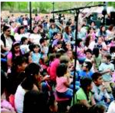
Мексикали – «Tecate festival»

была выбрана классическая сказка «Красная шапочка», которую участники семинара исполнили перед битком набитым залом, где также находился чешский посол и представители Магдалены Контрерас. Одновременно проводилась выставка картин участников художественного семинара.