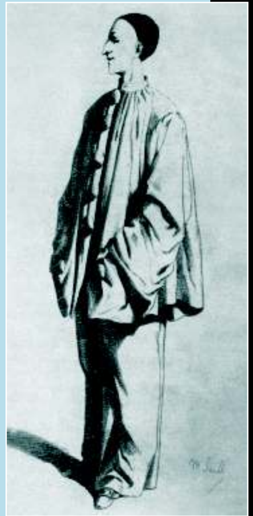
Дебюро в костюме Пьеро, рисунок М. Санда из его книги «Masques et Bouffons», Париж, 1862 г.

В один ноябрьский вечер 1840 года в кабинет доктора Рикардо вступил худой мужчина в черной одежде. Врач внимательно смотрел на интересного пациента, его высокий лоб, бледное лицо и тонкие губы.