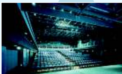
Большой зал театра «Арха»