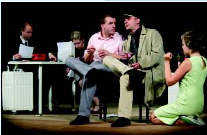
Постановка спектакля «Гротеск», режиссер Петр Леба, 1985 г.