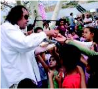
Мексикали – «Tecate festival»